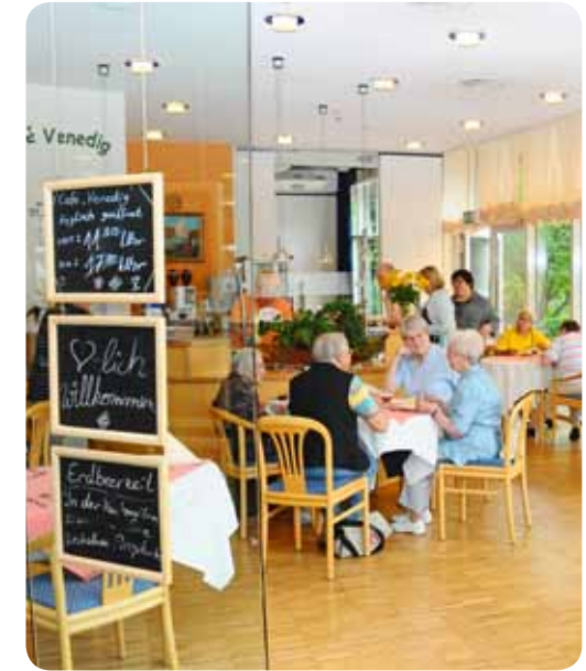
Im Garten mit Sommerterrasse gleich hinter dem Haus sowie im Café Venedig treffen sich Bewohner und Gäste.