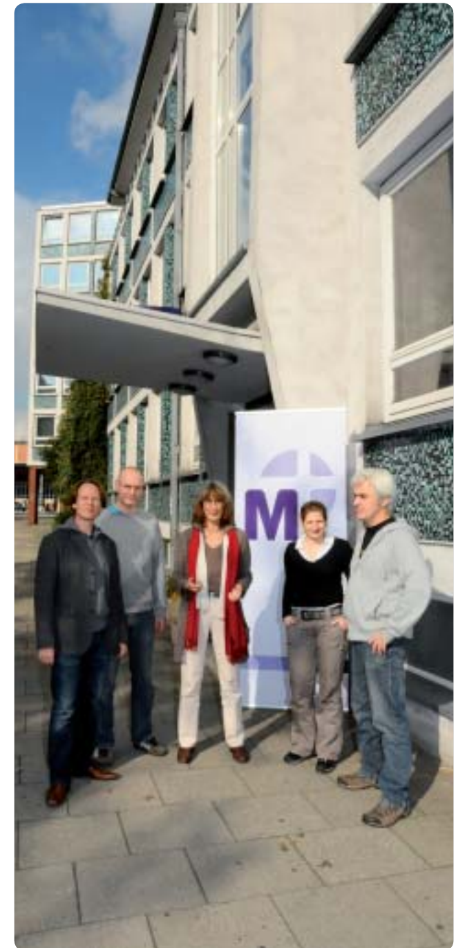
Der Eingang zur STZ Beratungsstelle Harburg